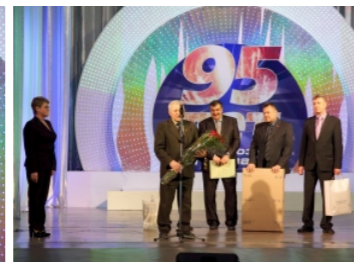
Поздравление от гостей праздника