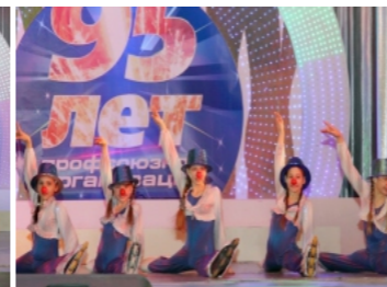
Призеры XV всероссийского отраслевого конкурса «Металлинка – 2012» - цирковой коллектив ДКМ «Кассиопея»