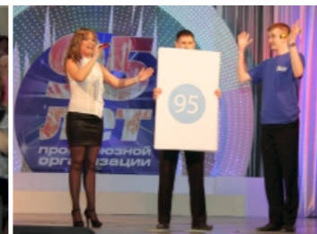
Творческое поздравление от молодежи завода