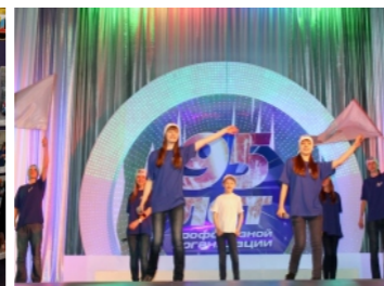
Поздравление от детей работников предприятия